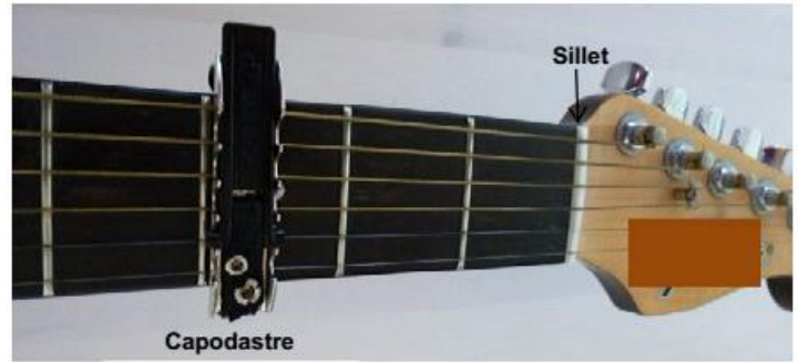
Photographie d'un capodastre placé sur la 3 ème case du manche d'une guitare.

Un capodastre est un accessoire que l'on fixe en travers du manche d'une guitare sur une case particulière. De composition très variable (élastique, ressort ou boulon), il raccourcit la longueur de toutes les cordes sans modifier leurs tensions, ce qui crée en fait un nouveau sillet. Toutes les cordes à vide jouent maintenant des tons de hauteur supérieure à ceux qu'elles produisent sans le capodastre.